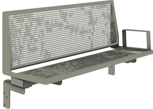
SB 6: Calidum Light Stahl perforiert