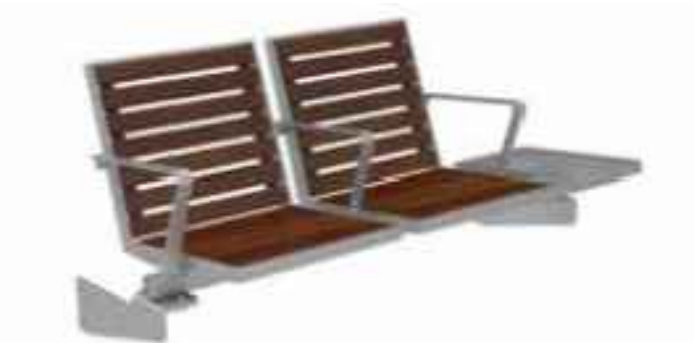
SB 2.2: Sedeo belattet (WSH 3-feldrig)