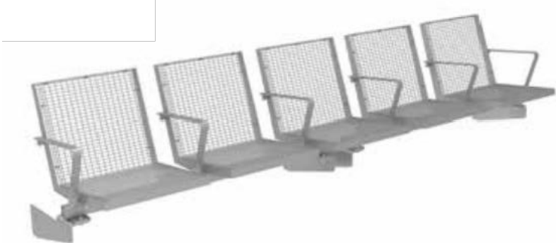
SB 1.1: Sedeo Drahtgitter (WSH 4-feldrig)