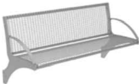
SB 3.1: Remissio Drahtgitter