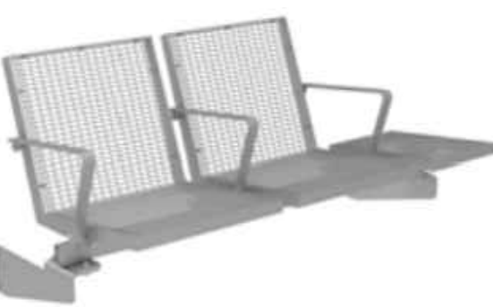
SB 2.1: Sedeo Drahtgitter (WSH 3-feldrig)