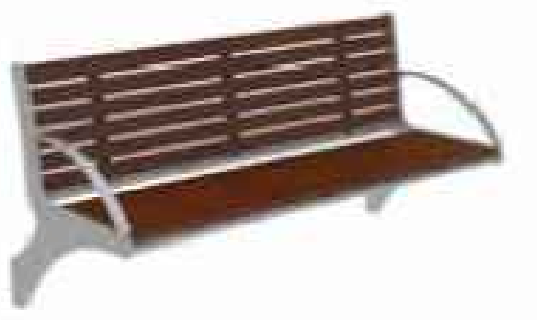
SB 3.2: Remissio belattet