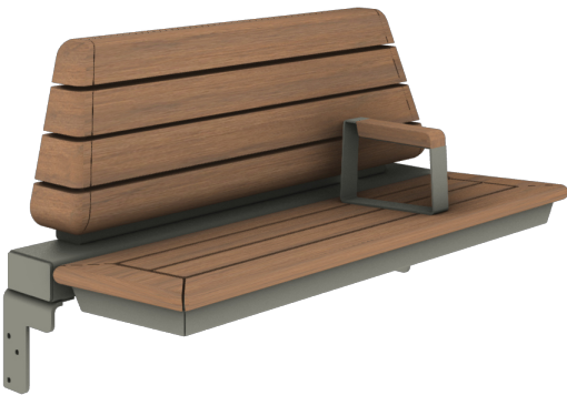
SB 4: Calidum Redesign