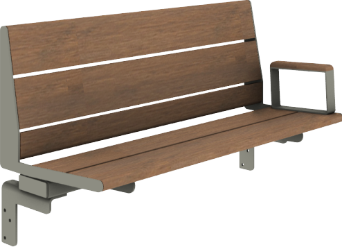
SB 5: Calidum Light belattet